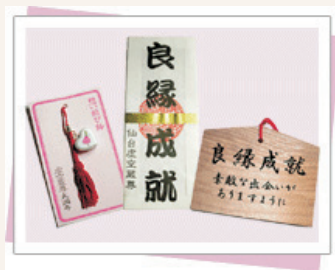
良縁三点セット (良縁祈禱の方に差し上げます)